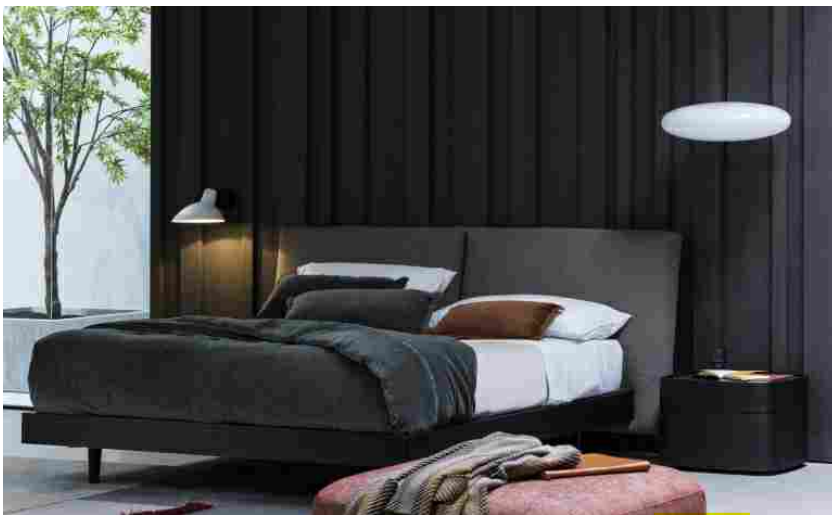
Novamobili, letto Twice

Tra le novità introdotte nel 2021 da Novamobili , parte di Battistella Company , gruppo nato nel 1953 a Pieve di Soligo (TV), si contano tre letti.