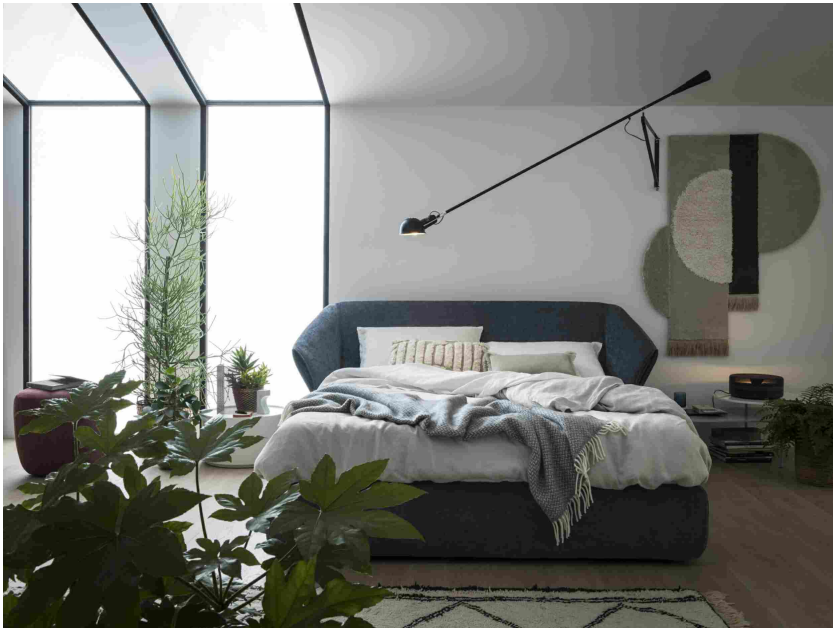
Novamobili, letto Hide

Disegnato da Silvia Prevedello , infine, il letto Groove unisce due elementi diversi nelle linee e nell'estetica in un insieme armonioso. La grande testiera imbottita, con cuciture verticali che ne addolciscono la forma, è collegata a un giroletto essenziale, reso leggero dalle gambe d'appoggio sottili.