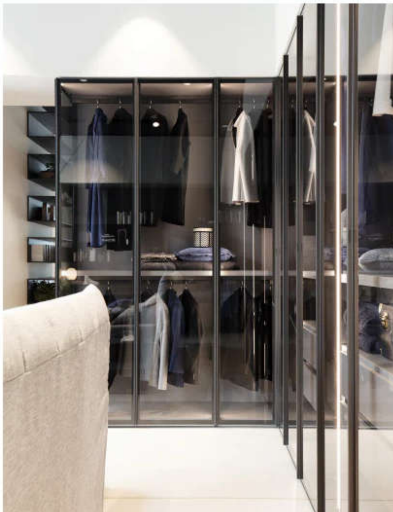
Armadio Perry by Novamobili Studio