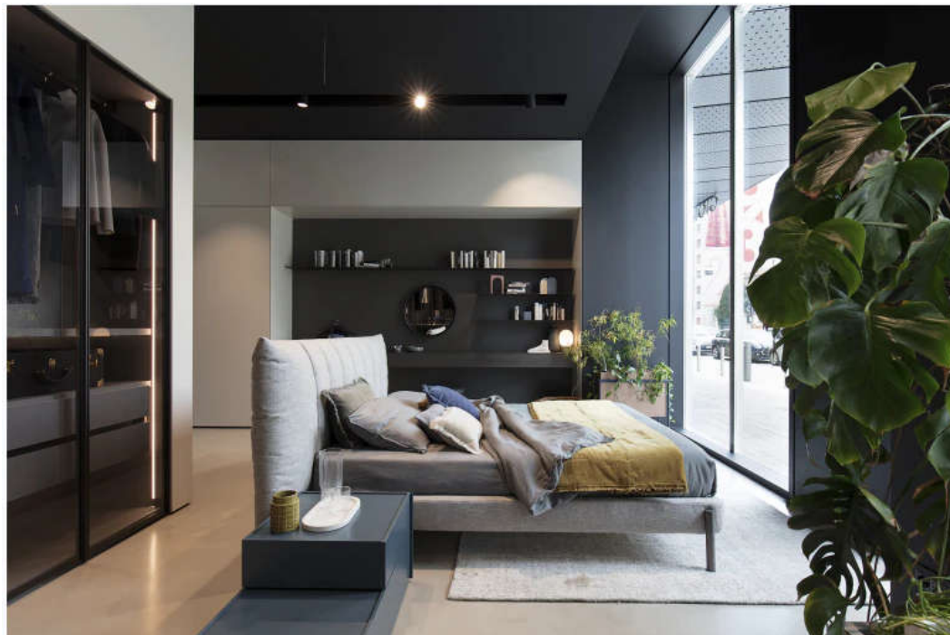
Letto Grove, design Silvia Prevedello, Novamobili